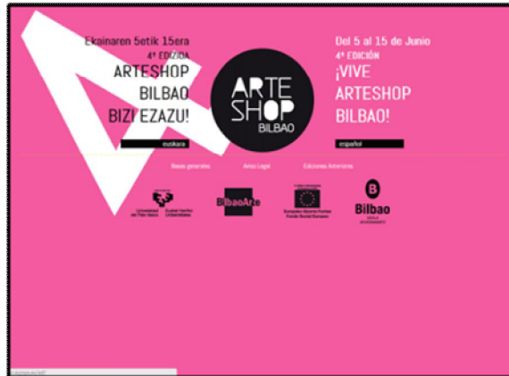
Portada de la web de ARTESHOP BILBAO 2014

Por otra parte, durante el tiempo de exposición los/las estudiantes y de manera paralela los/las artistas tutores/as expusieron en el Mercado de la Ribera y en la Oficina de Turismo inaugurada a principios de 2014. Estas exposiciones además de dar a conocer el trabajo de los/las artistas becados/as de la Fundación Bilbao Arte, sirvieron de reclamo para el propio evento.